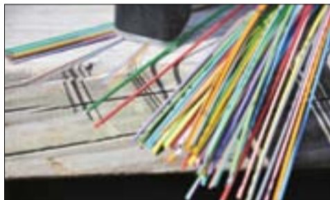
Så här kan en kabel med fiber se ut. I varje färgglad tråd ligger det dessutom tolv tunnare fibertrådar.

” Jag jobbar bara ute på landsbygden, i städerna finns kommersiella aktörer som sköter fiberutbyggnaden – men vem hjälper byar att komma igång? ”