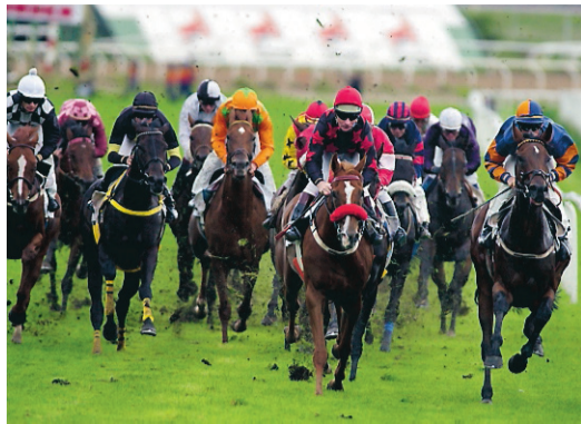
Skanska och JM ska köpa markområdet där Täby Galoppbana ligger.